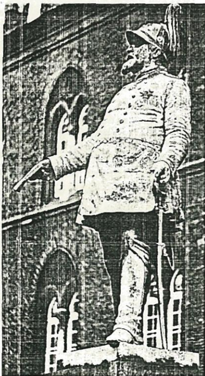
H.V.Bissen: Statue af Kong Frederik d. VII foran Rådhuset på Flakhaven Afsløret d. 5.juni 1868. Byens ældste statue.

Foreningens ordinære generalforsamling 1987 afholdes i Kreditforeningen Danmark Onsdag d. 22. april 1987, kl. 19 00 .