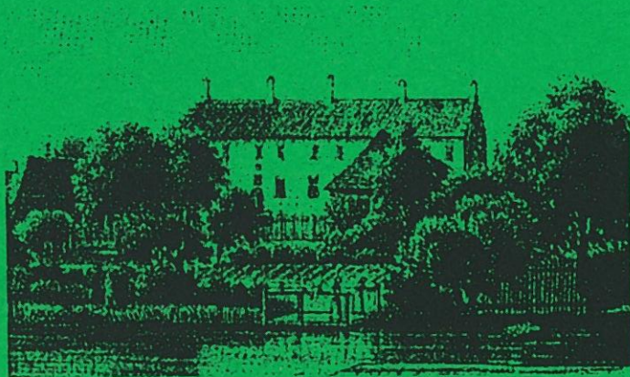
Odense Adelige Jomfrukloster

Et af byens meget omtalte, men desværre et af de tillukkede huse.